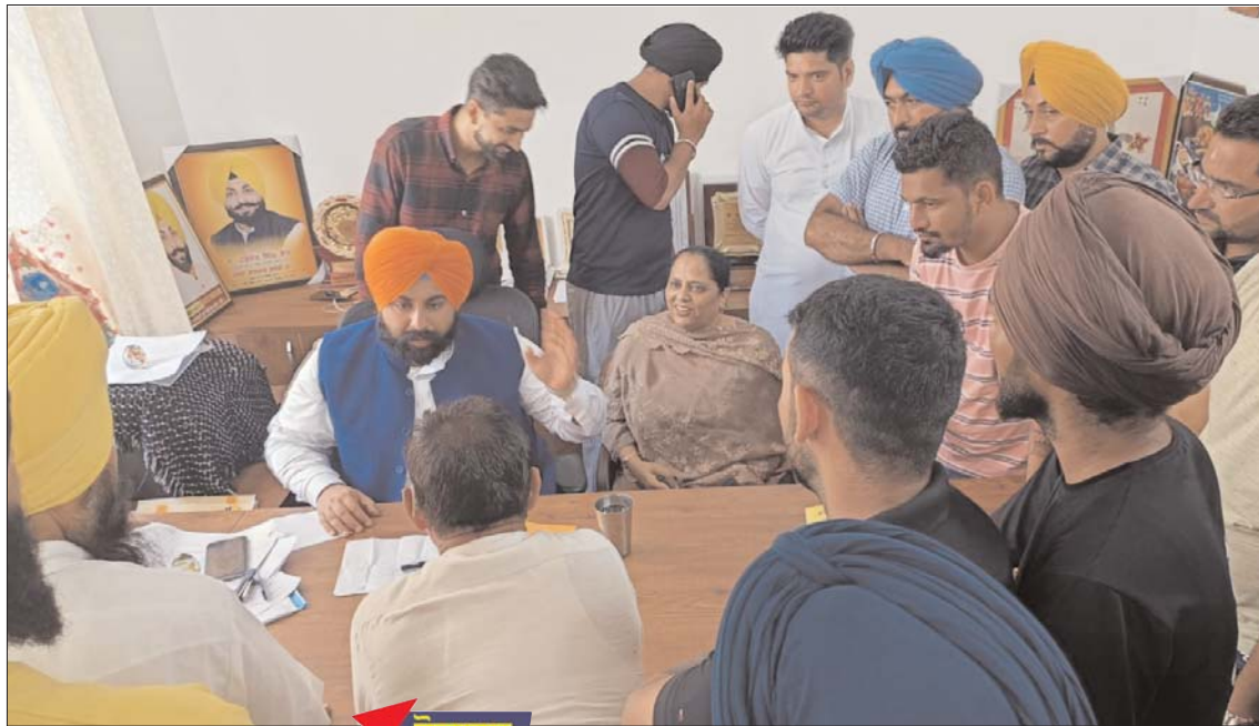
ਰੋਜ਼ਾਨਾ ਲੋਕ ਬਾਣੀ

ਦੱਸਿਆ ਕਿ ਪੰਜਾਬ ਸਰਕਾਰ ਦੇ ਲੋਕਹਿੱਤ ਵਿੱਚ ਲਏ ਜਾ ਰਹੇ ਫੈਸਲਿਆਂ ਅਤੇ ਲੋਕਪੱਖੀ ਕੰਮਾਂ ਤੇ ਪ੍ਰਭਾਵਿਤ ਲੋਕ ਕੈਬਨਿਟ ਮੰਤਰੀ ਦਾ ਵਿਸ਼ੇਸ਼ ਧੰਨਵਾਦ ਕਰਨ ਦੇ ਨਾਲ ਨਾਲ ਕੱਚੇ ਅਧਿਆਪਕਾਂ ਨੂੰ ਰਾਹਤ ਦੇਣ ਦੇ ਫੈਸਲੇ ਦੀ ਸ਼ਲਾਘਾ ਅਤੇ ਸਿੱਖਿਆ ਮੰਤਰੀ ਦਾ ਧੰਨਵਾਦ ਕਰਨ ਲਈ