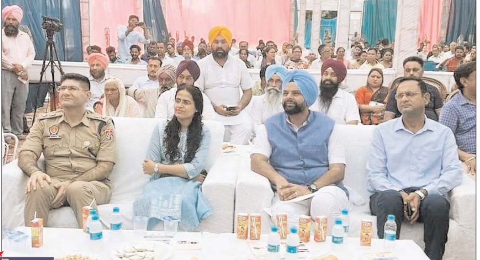
ਰੋਜ਼ਾਨਾ ਲੋਕ ਬਾਣੀ

ਚੰਡੀਗੜ੍ਹ ਰੇਲਵੇ ਸਟੇਸ਼ਨ ਅਤੇ ਪੰਜਾਬ ਦੇ 22 ਰੇਲਵੇ ਸਟੇਸ਼ਨਾਂ ਨੂੰ ਵੀ ਆਧੁਨਿਕ ਸਹੂਲਤਾਂ ਨਾਲ ਲੈਸ ਕੀਤਾ ਜਾਵੇਗਾ। ਉਨ੍ਹਾਂ ਦੱਸਿਆ ਕਿ ਇਸ ਯੋਜਨਾ ਤਹਿਤ ਸਟੇਸ਼ਨਾਂ ਤੱਕ ਯਾਤਰੀਆਂ ਦੀ ਪਹੁੰਚ, ਸਰਕੂਲੇਟਿੰਗ ਏਰੀਆ, ਵੇਟਿੰਗ ਹਾਲ, ਪਖਾਨੇ, ਲਿਫਟ/ਐਸਕੇਲੇਟਰ, ਲੋੜ ਅਨੁਸਾਰ ਸਫਾਈ, ਮੁਫਤ ਵਾਈ-ਫਾਈ, ਕਿਓਸਕ ਵਰਗੀਆਂ ਸਹੂਲਤਾਂ ਨੂੰ ਬਿਹਤਰ ਬਣਾਉਣ ਲਈ ਇੱਕ ਮਾਸਟਰ ਪਲਾਨ ਤਿਆਰ ਕੀਤਾ ਗਿਆ ਹੈ। ਹਰੇਕ ਸਟੇਸ਼ਨ ਦੀਆਂ ਜ਼ਰੂਰਤਾਂ ਨੂੰ ਧਿਆਨ ਵਿੱਚ ਰੱਖਦੇ ਹੋਏ, 'ਇੱਕ ਸਟੇਸ਼ਨ ਇੱਕ ਉਤਪਾਦ', ਬਿਹਤਰ ਯਾਤਰੀ ਸੂਚਨਾ ਪ੍ਰਣਾਲੀ, ਕਾਰਜਕਾਰੀ ਲੌਜ, ਵਪਾਰਕ ਮੀਟਿੰਗਾਂ ਲਈ ਨਿਰਧਾਰਤ ਜਗ੍ਹਾ, ਲੈਂਡਸਕੇਪਿੰਗ ਆਦਿ