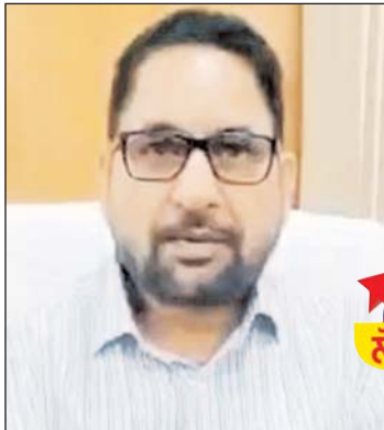
ਇਸ ਤੋਂ ਇਲਾਵਾ ਲਾਭਪਾਤਰੀਆਂ ਨੂੰ 33559 ਕੇਂਡੋਮ ਵੰਡੇ ਗਏ। 1045 ਅੱਰਤਾਂ ਨੂੰ ਮਾਲਾ ਐਨ, 514 ਅੱਰਤਾਂ ਨੂੰ ਫਾਇਆ ਗੋਲੀ, 485 ਅੱਰਤਾਂ ਨੂੰ

● ਗੁਰਦਾਸਪੁਰ-ਨਵਨੀਤ ਕੁਮਾਰ ਸਿਵਲ ਸਰਜਨ ਗੁਰਦਾਸਪੁਰ ਡਾ. ਹਰਭਜਨ ਰਾਮ ਮਾਂਡੀ ਦੇ ਦਿਸ਼ਾ ਨਿਰਦੇਸ਼ਾਂ ਅਤੇ ਜ਼ਿਲ੍ਹਾ ਪਰਿਵਾਰ ਭਲਾਈ ਅਫ਼ਸਰ ਡਾ. ਤੇਜਿੰਦਰ ਕੌਰ ਦੀ ਅਗੁਵਾਈ ਹੇਠ ਵਿਸ਼ਵ ਆਬਾਦੀ ਦਿਵਸ ਸਬੰਧੀ ਪਖਵਾੜੇ ਵਿੱਚ ਜ਼ਿਲ੍ਹਾ ਗੁਰਦਾਸਪੁਰ ਨੇ ਵਧੀਆ ਕਾਰਗੁਜ਼ਾਰੀ ਕੀਤੀ ਹੈ। ਇਸ ਸਬੰਧੀ ਸਿਵਲ ਸਰਜਨ ਗੁਰਦਾਸਪੁਰ ਡਾ. ਹਰਭਜਨ ਰਾਮ ਮਾਂਡੀ ਨੇ ਦੱਸਿਆ ਕਿ 11 ਤੋਂ 24 ਜੁਲਾਈ 2023 ਤੱਕ ਵਿਸ਼ਵ ਆਬਾਦੀ ਦਿਵਸ ਦੇ ਪਖਵਾੜੇ ਦੌਰਾਨ ਜ਼ਿਲ੍ਹੇ ਦੀਆਂ 5 ਸਿਹਤ ਸੰਸਥਾਵਾਂ ਵਿੱਚ ਨਲਬੰਦੀ ਜਦਕਿ 4 ਸੰਸਥਾਵਾਂ ਵਿੱਚ ਨਸਬੰਦੀ ਕੇਸਾਂ ਦੀ ਸਹੂਲਤ ਮੁਹੱਈਆ ਕਰਵਾਈ ਗਈ ਸੀ। ਪਖਵਾੜੇ ਦੌਰਾਨ ਜ਼ਿਲ੍ਹਾ ਗੁਰਦਾਸਪੁਰ ਵਿੱਚ ਇਸ ਸਾਲ ਨਲਬੰਦੀ ਦੇ 186, ਨਸਬੰਦੀ ਦੇ 11, ਕਾਪਰ ਟੀ ਦੇ 519, ਜਣੇਪੇ ਤੋਂ ਬਾਅਦ ਕਾਪਰ ਟੀ ਦੇ 60 ਕੇਸ ਹੋਏ ਹਨ। 64 ਅੱਰਤਾਂ ਨੂੰ ਡੋਪਾ ਇੰਜੈਕਸ਼ਨ ਲਗਾਇਆ।