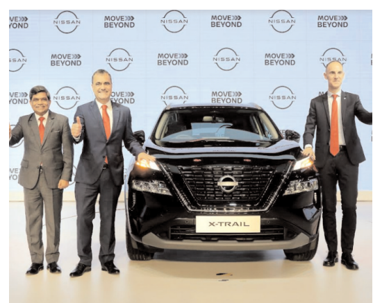
1 ਲੱਖ ਤੋਂ ਵੱਧ ਗਾਹਕ ਬੁਕਿੰਗਾਂ ਦੇ ਨਾਲ ਕੰਪਨੀ ਦਾ ਸਕਾਰਾਤਮਕ ਵਾਧਾ ਜਾਰੀ ਰਿਹਾ ਹੈ। ਸਾਡਾ ਜ਼ੋਰ ਲਗਾਤਾਰ ਸਥਾਨਕ ਬਾਜ਼ਾਰ 'ਤੇ ਹੈ ਤੇ ਅਸੀਂ 15 ਤੋਂ ਵੱਧ ਦੇਸ਼ਾਂ ਵਿੱਚ ਐਕਸਪੋਰਟ ਕਰਦੇ ਹਾਂ।