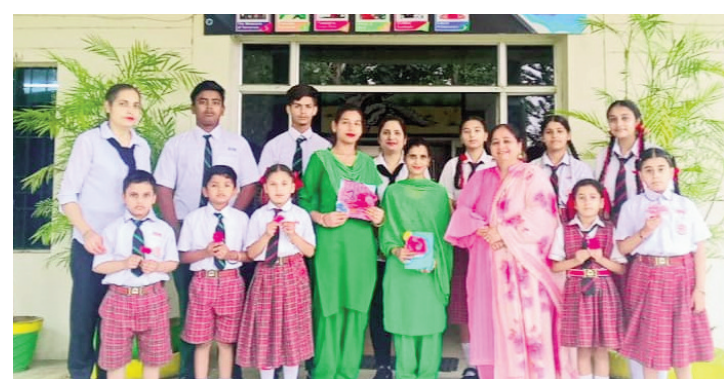
ਕਰਵਾਇਆ। ਉਨ੍ਹਾਂ ਕਿਹਾ ਕਿ ਮਜ਼ਦੂਰਾਂ ਅਤੇ ਕਿਰਤੀਆਂ ਦਾ ਸਨਮਾਨ ਕਰਨ ਦੇ ਮਕਸਦ ਨਾਲ ਹਰ ਸਾਲ ਵਿਸ਼ਵ ਭਰ ਵਿੱਚ ਮਜ਼ਦੂਰ ਦਿਵਸ ਮਨਾਇਆ ਜਾਂਦਾ ਹੈ। ਇਸ ਦਿਨ ਦੀ ਸ਼ੁਰੂਆਤ ਮਜ਼ਦੂਰਾਂ ਦੇ ਹੱਕਾਂ ਲਈ ਆਪਣੀ ਆਵਾਜ਼ ਬੁਲੰਦ ਕਰਕੇ ਸਮਾਜ ਵਿੱਚ ਉਨ੍ਹਾਂ ਦੀ ਸਥਿਤੀ ਨੂੰ ਮਜ਼ਬੂਤ ਕਰਨ ਲਈ ਕੀਤੀ ਗਈ ਸੀ। ਇਸ ਤੋਂ ਬਾਅਦ ਕਈ ਦੇਸ਼ਾਂ ਵੱਲੋਂ ਕੰਮਕਾਜੀ ਸੀਮਾ ਲਾਗੂ ਕੀਤੀ ਗਈ ਅਤੇ ਹਰ ਕਿਸੇ ਨੂੰ ਬਾਲ ਮਜ਼ਦੂਰੀ ਰੋਕਣ ਲਈ ਪ੍ਰੇਰਿਤ ਕੀਤਾ

ਜਲੰਧਰ (ਲੋਕ ਬਾਣੀ) ਸਬਰ, ਮਿਹਨਤ, ਸਹਿਣਸ਼ੀਲਤਾ ਦੀ ਸਭ ਤੋਂ ਵਧੀਆ ਮਿਸਾਲ ਸਹਾਇਕ ਸਟਾਫ਼ ਹੈ। ਇਨ੍ਹਾਂ ਸਤਰਾਂ ਨੂੰ ਬੋਲਦਿਆਂ ਡਿਪਸ ਚੇਨ ਦੇ ਸਾਰੇ ਸਕਲਾਂ ਵਿੱਚ ਮਜ਼ਦੂਰ ਦਿਵਸ ਮੌਕੇ ਕਰਵਾਏ ਪ੍ਰੋਗਰਾਮ ਵਿੱਚ ਸਹਾਇਕ ਸਟਾਫ਼ ਨੂੰ ਸਨਮਾਨਿਤ ਕੀਤਾ ਗਿਆ। ਸਟਾਫ਼ ਅਤੇ ਬੱਚਿਆਂ ਵੱਲੋਂ ਸਹਿਯੋਗੀ ਸਟਾਫ਼ ਲਈ ਵੱਖ-ਵੱਖ ਗਤੀਵਿਧੀਆਂ, ਨਾਟਕ ਅਤੇ ਖੇਡਾਂ ਕਰਵਾਈਆਂ ਗਈਆਂ। ਸਾਰਿਆਂ ਨੇ ਮਿਲ ਕੇ ਮਜ਼ੇਦਾਰ ਖੇਡਾਂ, ਅੰਤਾਕਸ਼ਰੀ ਖੇਡੀ। ਅਧਿਆਪਕਾਂ ਨੇ ਬੱਚਿਆਂ ਨੂੰ ਇਸ ਦਿਨ ਦੀ ਮਹੱਤਤਾ ਤੋਂ ਜਾਣੂ