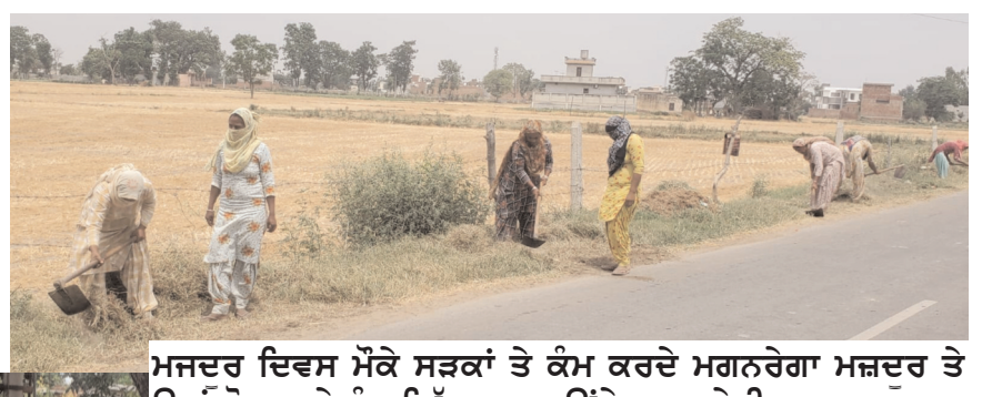
ਮਜ਼ਦੂਰ ਦਿਵਸ ਮੌਕੇ ਸੜਕਾਂ ਤੇ ਕੰਮ ਕਰਦੇ ਮਗਨਰੇਗਾ ਮਜ਼ਦੂਰ ਤੇ ਉਨ੍ਹਾਂ ਕੋਲ ਜਾਕੇ ਮੁੰਗ ਮਿੱਠਾ ਕਰਵਾਉਂਦੇ ਸਮਾਜਸੇਵੀ।