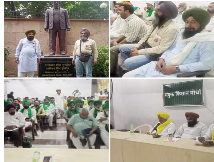
ਦੇਸ਼ ਛੱਡੋ ਦਾ ਨਾਹਰਾ ਬੁਲੰਦ ਕੀਤਾ ਜਾਵੇਗਾ, 1 ਸਤੰਬਰ ਤੋਂ 26 ਨਵੰਬਰ

ਕੀਤੀਆਂ ਜਾਣ। ਉਨ੍ਹਾਂ ਨੇ ਕਿਹਾ ਕਿ ਨਰਿੰਦਰ ਮੋਦੀ ਦੀ ਸਰਕਾਰ ਨੇ ਪਿਛਲੇ ਅੱਠ ਸਾਲਾਂ ਕਾਰਪੋਰੇਟ ਘਰਾਣਿਆਂ ਦਾ 11 ਲੱਖ ਕਰੋੜ ਰੁਪਏ ਦਾ ਕਰਜ਼ਾ ਮੁਆਫ਼ ਕੀਤਾ ਹੈ। ਪੁੰਜੀਪਤੀਆਂ ਨੂੰ ਲਾਭ ਦਿੱਤੇ ਹਨ। ਪਰ ਦੇਸ਼ ਦੇ ਕਿਸਾਨਾਂ ਮਜ਼ਦੂਰਾਂ ਦਾ ਕਰਜ਼ਾ ਮੁਆਫ਼ ਨਹੀਂ ਕੀਤਾ। ਐਸ ਕੇ ਐਮ ਵਿੱਚ ਹੋਰ ਕਿਸਾਨ ਜਥੇਬੰਦੀਆਂ ਨੂੰ ਸ਼ਾਮਲ ਕੀਤਾ ਜਾਵੇਗਾ। ਅੰਦੋਲਨ ਦੇ ਪਹਿਲੇ ਪੜਾਅ ਵਜੋਂ 26 ਤੋਂ 31 ਮਈ ਤੱਕ ਸੰਸਦ ਮੈਂਬਰਾਂ ਨੂੰ ਚਿਤਾਵਨੀ ਪੱਤਰ ਦਿੱਤੇ ਜਾਣ, ਸੂਬਾ ਪੱਧਰ ਤੇ ਕਿਸਾਨ ਮਜ਼ਦੂਰ ਜਥੇਬੰਦੀਆਂ ਦੀਆਂ ਸਾਂਝੀਆਂ ਕਨਵੈਨਸ਼ਨਾਂ, 9 ਅਗਸਤ ਨੂੰ ਮੋਦੀ