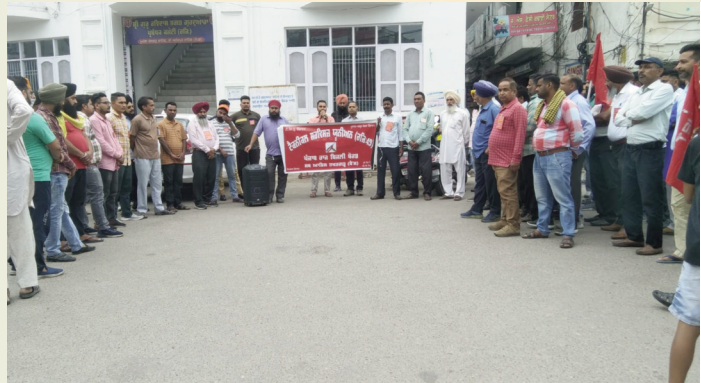
ਕੇ ਮਜ਼ਦੂਰਾਂ ਦੇ ਹੱਕਾਂ ਦੀ ਪ੍ਰਾਪਤੀ ਕੀਤੀ ਸੀ। ਪਰੰਤੂ ਅੱਜ ਸਾਡੀਆਂ