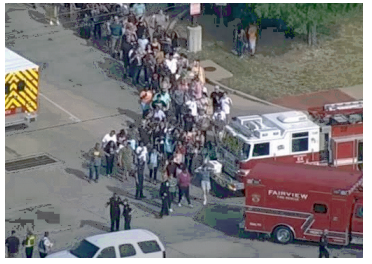
ਸੋਸ਼ਲ ਮੀਡੀਆ 'ਤੇ ਵਾਇਰਲ ਹੋਈ ਹੈ। ਪੁਲੀਸ ਵਲੋਂ ਜਵਾਬੀ ਕਾਰਵਾਈ ਵਿੱਚ ਹਮਲਾਵਰ ਦੀ ਵੀ ਮੌਤ ਹੋ ਗਈ।

ਐਲਨ (ਲੋਕ ਬਾਣੀ) ਇਥੋਂ ਦੇ ਇਕ ਮੌਲ ਵਿੱਚ ਇਕ ਹਮਲਾਵਰ ਨੇ ਲੋਕਾਂ 'ਤੇ ਅੱਗ ਵੱਢੀ ਗੋਲੀਆਂ ਚਲਾ ਕੇ ਅੱਠ ਜਣਿਆਂ ਨੂੰ ਮਾਰ ਦਿੱਤਾ, ਇਸ ਗੋਲੀਬਾਰੀ ਵਿੱਚ ਸੱਤ ਜਣੇ ਜ਼ਖਮੀ ਹੋ ਗਏ ਜਿਨ੍ਹਾਂ ਵਿੱਚੋਂ ਤਿੰਨ ਦੀ ਹਾਲਤ ਗੰਭੀਰ ਹੈ। ਅਮਰੀਕੀ ਪੁਲੀਸ ਅਧਿਕਾਰੀਆਂ ਨੇ ਇਸ ਘਟਨਾ ਦੇ ਵੇਰਵੇ ਸੋਸ਼ਲ ਮੀਡੀਆ 'ਤੇ ਸਾਂਝੇ ਕੀਤੇ ਹਨ ਤੇ ਇਸ ਸਬੰਧੀ ਵੀਡੀਓ ਵੀ