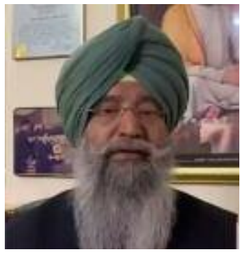
ਕਿਉਂ ਨਹੀਂ ਕੀਤੀ ਜਾ ਰਹੀ। ਭਾਰਤ ਸਰਕਾਰ ਵਲੋਂ ਕਮਿਸ਼ਨ ਨੂੰ ਹੋਰ ਗੱਲਾਂ ਦੇ ਨਾਲ-ਨਾਲ ਘੱਟ ਗਿਣਤੀ ਭਾਈਚਾਰਿਆਂ ਦੇ ਹਿੱਤਾਂ ਦੀ ਰਾਖੀ ਕਰਨ ਦੀ ਜ਼ਿੰਮੇਵਾਰੀ ਸੌਂਪੀ ਗਈ ਹੈ। ਇਸ ਤੋਂ ਇਲਾਵਾ, ਕਮਿਸ਼ਨ ਦੀ ਭੂਮਿਕਾ ਘੱਟ-ਗਿਣਤੀ ਭਾਈਚਾਰਿਆਂ ਦੇ ਮੈਂਬਰਾਂ ਵਿੱਚ ਵਿਸ਼ਵਾਸ ਪੈਦਾ ਕਰਨ ਦੇ ਉਪਾਅ ਕਰਨ ਦੀ ਵੀ ਹੈ। ਇਸ ਤੋਂ

ਘਟਨਾਵਾਂ ਨੂੰ ਟਾਲਿਆ ਜਾ ਸਕਦਾ ਸੀ ਜੇਕਰ ਅਪਰਾਧੀਆਂ ਨੂੰ ਸਖ਼ਤ ਸਜ਼ਾਵਾਂ ਦਿੱਤੀਆਂ ਗਈਆਂ ਹੁੰਦੀਆਂ ਅਤੇ ਇਨ੍ਹਾਂ ਸਾਰੇ ਮਾਮਲਿਆਂ ਦੀ ਨਿਰਪੱਖ ਜਾਂਚ ਕੀਤੀ ਜਾਂਦੀ। ਐਨਸੀਐਮ ਐਕਟ, 1992 ਦੇ ਤਹਿਤ ਗਠਿਤ ਰਾਸ਼ਟਰੀ ਘੱਟ ਗਿਣਤੀ ਕਮਿਸ਼ਨ (ਐਨਸੀਐਮ) ਨੇ ਪੰਜਾਬ ਦੇ ਮੁੱਖ ਸਕੱਤਰ ਨੂੰ ਇੱਕ ਪੱਤਰ ਲਿਖ ਕੇ ਪਿਛਲੇ 45 ਸਾਲਾਂ ਵਿੱਚ ਪੰਜਾਬ ਵਿੱਚ ਬੇਅਦਬੀ ਦੇ ਸਾਰੇ ਮਾਮਲਿਆਂ ਦੀ ਸੂਚੀ ਮੰਗੀ ਹੈ। ਐਨ ਸੀ ਐਮ ਨੇ ਜਨਤਾ ਨੂੰ ਸ਼ਾਂਤੀ ਅਤੇ ਫ਼ਰਿਕੂ ਸਦਭਾਵਨਾ ਬਣਾਈ ਰੱਖਣ ਦੀ ਬੇਨਤੀ ਕੀਤੀ ਹੈ। ਕਮਿਸ਼ਨ ਇਸ ਗਲ 'ਤੇ ਚਿੰਤਤ ਹੈ ਕਿ ਅਜਿਹਾ ਵਾਰ-ਵਾਰ ਕਿਉਂ ਹੋ ਰਿਹਾ ਹੈ ਅਤੇ ਇਸ ਦੀ ਰੋਕਥਾਮ