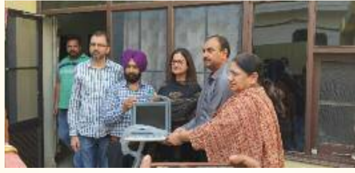
ਛਾਪਾ ਮਾਰ ਕੇ ਮੌਕੇ 'ਤੇ ਅਣਰ-ਸਾਊਂਡ ਮਸ਼ੀਨ ਬਰਾਮਦ ਕੀਤੀ ਜਸਟਰ ਪੋਰਟੇਬਲ ਅਲਟਰਾ ਗਈ . ਉਨ੍ਹਾਂ ਦੱਸਿਆ ਕਿ ਸਿਹਤ

ਵਿਭਾਗ ਵਲੋਂ ਇੱਕ ਡਿਕਾਏ ਸੀ . ਥਾਣਾ ਫੋਕਲ ਪੁਆਇੰਟ ਦੀ ਮਰੀਜ਼ ਰਾਹੀਂ 32 ਹਜ਼ਾਰ ਰੁਪਏ ਪੁਲਿਸ ਵਲੋਂ ਮੌਕੇ 'ਤੇ ਇੱਕ ਵਿਚ ਸੌਦਾ ਤਹਿ ਕੀਤਾ ਗਿਆ ਸੀ ਵਿਅਕਤੀ ਅਤੇ ਦੋ ਔਰਤਾਂ ਨੂੰ ਅਤੇ ਟੀਮ ਵਲੋਂ ਛਾਪੇ ਮਾਰੀ ਦੌਰਾਨ ਗ੍ਰਿਫਤਾਰ ਕਰ ਲਿਆ ਹੈ . ਉਨ੍ਹਾਂ ਮੌਕੇ ਤੋਂ 30 ਹਜ਼ਾਰ ਰੁਪਏ ਦੀ ਕਿਹਾ ਕਿ ਜ਼ਿਲ੍ਹੇ ਭਰ ਵਿਚ ਚੱਲ ਨਗਦੀ ਵੀ ਬ੍ਰਾਮਦ ਕੀਤੀ ਗਈ ਜੋ ਰਹੇ ਅਲਟਰਾਸਾਊਂਡ ਸੈਂਟਰਾਂ ਦਾ ਕਿ ਵਿਭਾਗ ਵਲੋਂ ਮਾਰਕ ਕੀਤੇ ਕੋਈ ਮਾਲਕ ਸਿਹਤ ਵਿਭਾਗ ਨੋਟਾਂ ਨਾਲ ਮੇਲ ਖਾ ਗਈ . ਉਨ੍ਹਾਂ ਦੀਆਂ ਹਦਾਇਤਾਂ ਦੀ ਉਲੰਘਣਾ ਅੱਗੇ ਦੱਸਿਆ ਕਿ ਇਸ ਗੌਰਖਪੰਦੇ ਕਰਦਾ ਪਾਇਆ ਗਿਆ ਤਾਂ ਉਸ ਨੂੰ ਇੱਕ ਵਿਅਕਤੀ ਅਤੇ ਦੋ ਖਿਲਾਫ ਵੀ ਸਖ਼ਤ ਕਾਰਵਾਈ ਔਰਤਾਂ ਵਲੋਂ ਚਲਾਇਆ ਜਾਂ ਰਿਹਾ ਅਮਲ ਵਿੱਚ ਲਿਆਂਦੀ ਜਾਵੇਗੀ .