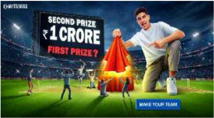
'ਆਊਟ ਆਫ ਦਿ ਪਾਰਕ' ਸੀਜ਼ਨ ਦੌਰਾਨ ਪ੍ਰਸ਼ੰਸਕਾਂ ਨੂੰ ਵਰਗੀਆਂ ਮੁਹਿੰਮਾਂ ਦੇ ਨਾਲ ਵਿਲੱਖਣ ਅਤੇ ਰੋਮਾਂਚਕ ਅਨੁਭਵ ਮਾਈ11ਸਰਕਲ ਦਾ ਉਦੇਸ਼ ਇਸ ਪ੍ਰਦਾਨ ਕਰਨਾ ਹੈ।

ਚੰਡੀਗੜ੍ਹ (ਲੋਕ ਬਾਣੀ) ਮਲਟੀ-ਗੇਮਿੰਗ ਪਲੇਟਫਾਰਮ , ਮਾਈ11 ਸਰਕਲ ਇੱਕ ਦਿਲਚਸਪ ਨਵੀਂ ਮੁਹਿੰਮ ਦੇ ਨਾਲ ਇਸ ਆਈਪੀਐਲ ਸੀਜ਼ਨ ਵਿੱਚ ਰੋਮਾਂਚ ਵਧਾਉਣ ਲਈ ਤਿਆਰ ਹੈ। ਫੈਨਟੇਸੀ ਕ੍ਰਿਕਟ ਪਲੇਟਫਾਰਮ ਅਤੇ ਆਈਪੀਐਲ ਫਰੈਂਚਾਇਜ਼ੀ ਲਖਨਊ ਸੁਪਰ ਜਾਇੰਟਸ ਦੇ ਅਧਿਕਾਰਤ ਟਾਈਟਲ ਸਪਾਂਸਰ ਨੇ ਆਗਾਮੀ ਕ੍ਰਿਕਟ ਸੀਜ਼ਨ ਲਈ ਇੱਕ ਦਿਲਚਸਪ ਫੈਨ ਮੁਹਿੰਮ ਲਾਈਨ-ਅੱਪ ਦਾ ਉਦਘਾਟਨ ਕੀਤਾ ਹੈ। 'ਬੜੇ ਸੇ ਵੱਡਾ', 'ਲਾਕਰ ਰੂਮ ਸਟੋਰੀਜ਼' ਅਤੇ