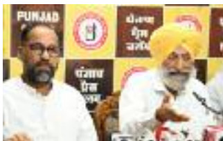
ਰਹਿਣ। ਇਥੇ ਇਕ ਪ੍ਰੈਸ ਕਾਨਫਰੰਸ ਵਿਚ ਇਸ ਗੱਲ ਦੇ ਵੇਰਵੇ ਸਾਂਝੇ ਕਰਦਿਆਂ ਅਕਾਲੀ ਦਲ ਦੇ ਸੀਨੀਅਰ ਆਗੂ ਸਰਦਾਰ