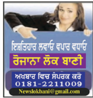
ਇਸ਼ਤਿਹਾਰ ਲਵਾਓ ਵਪਾਰ ਵਪਾਓ ਰੋਜ਼ਾਨਾ ਲੋਕ ਬਾਣੀ ਅਖਬਾਰ ਵਿਚ ਸੰਪਰਕ ਕਰੋ 0181-2211009 Newslokbanii@gmail.com

R.N.I. Punpun/29016/2008 * ਸਾਲ : 14, ਅੰਕ : 567, ਮੁੱਲ : 5.00 ਰੁਪਏ, ਕੁੱਲ ਪੇਜ : 8, ਫੈਕਸ : 0181-2211009, 99155-94111