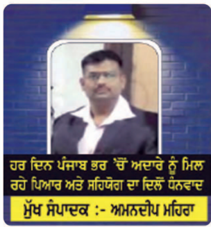
ਹਰ ਦਿਨ ਪੰਜਾਬ ਭਰ 'ਚੋਂ ਅਦਾਰੇ ਨੂੰ ਮਿਲ ਰਹੇ ਪਿਆਰ ਅਤੇ ਸ਼ਹਿਯੋਗ ਦਾ ਦਿਲੋਂ ਧੰਨਵਾਦ ਮੁੱਖ ਸੰਪਾਦਕ :- ਅਮਨਦੀਪ ਮਹਿਰਾ