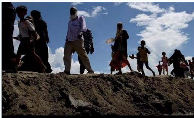
ਸਹਿਰ ਨੇੜੇ ਐਤਵਾਰ ਨੂੰ ਨਿਯਮਿਤ ਤਲਾਸ਼ੀ ਦੌਰਾਨ ਕਾਰਾਂ ਨੂੰ ਰੋਕਿਆ ਅਤੇ

ਆਸਾਮ ਪੁਲਸ ਨੇ ਮਿਆਮਾਰ ਦੇ 26 ਸੌਂਕੀ ਰੋਹਿੰਗਿਆ ਲੋਕਾਂ ਨੂੰ ਨੌਕਰੀਆਂ ਦੀ ਭਾਲ ਵਿਚ 'ਗੈਰ-ਕਾਨੂੰਨੀ ਢੰਗ ਨਾਲ ਕਛਾਰ ਜਾਂ ਲੋਕਾਂ ਵਿਚ ਦਾਖਲ ਹੋਣ' ਦੇ ਦੋਸ਼ ਵਿਚ ਹਿਰਾਸਤ 'ਚ ਲਿਆ ਹੈ। ਇਕ ਪੁਲਸ ਅਧਿਕਾਰੀ ਨੇ ਸੋਮਵਾਰ ਨੂੰ ਇਹ ਜਾਣਕਾਰੀ ਦਿੱਤੀ। ਉਨ੍ਹਾਂ ਦੱਸਿਆ ਕਿ ਤਿੰਨ ਪਰਿਵਾਰਾਂ ਦੇ 26 ਲੋਕ ਕਥਿਤ ਤੌਰ 'ਤੇ ਗੁਰਾਟੀ ਤੋਂ ਤਿੰਨ ਵਾਹਨਾਂ 'ਚ ਸਵਾਰ ਹੋ ਕੇ ਇੱਥੇ ਪੁੱਜੇ ਸਨ ਅਤੇ ਜੰਮੂ ਤੋਂ ਰੇਲਗੱਡੀ ਰਾਹੀਂ ਕਾਮਾਖਿਆ ਰੇਲਵੇ ਸਟੇਸ਼ਨ ਆਏ ਸਨ। ਪੁਲਸ ਨੇ ਸਿਲਚਰ