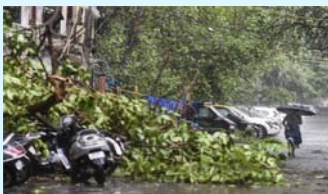
ਬਹਾਦਰ ਸਾਹ ਜਫ਼ਰ ਮਾਰਗ 'ਤੇ ਸਥਿਤ ਐਕਸਪ੍ਰੈਸ ਬਿਲਡਿੰਗ ਦੇ ਕਈ ਏਸੀ ਯੂਨਿਟ ਟੁੱਟ ਕੇ ਲਟਕ ਗਏ। ਇਕ ਪੱਤਰਕਾਰ ਨੇ

ਦਿੱਲੀ 'ਚ ਸੋਮਵਾਰ ਨੂੰ ਤੇਜ਼ ਹਵਾਵਾਂ ਦੇ ਨਾਲ ਮੋਹਲੇਪਾਰ ਮੀਂਹ ਪਿਆ, ਜਿਸ ਕਾਰਨ ਕਈ ਥਾਵਾਂ 'ਤੇ ਬਿਜਲੀ ਬੈਦ ਹੋ ਗਈ। ਮੌਸਮ ਵਿਚ ਆਈ ਤਬਦੀਲੀ ਕਾਰਨ ਪੈ ਰਹੀ ਕੜਾਕੇ ਦੀ ਗਰਮੀ ਤੋਂ ਪਰੇਸ਼ਾਨ ਦਿੱਲੀ ਵਾਸੀਆਂ ਨੂੰ ਕੁਝ ਰਾਹਤ ਮਿਲੀ ਹੈ। ਮੀਂਹ ਦੇ ਨਾਲ ਬੱਦਲ ਵੀ ਗਰਜੇ ਅਤੇ 50 ਕਿਲੋਮੀਟਰ ਪ੍ਰਤੀ ਘੰਟਾ ਦੀ ਰਫ਼ਤਾਰ ਤੇਜ਼ ਹਵਾਵਾਂ ਚੱਲੀਆਂ। ਤੇਜ਼ ਹਵਾਵਾਂ ਕਾਰਨ