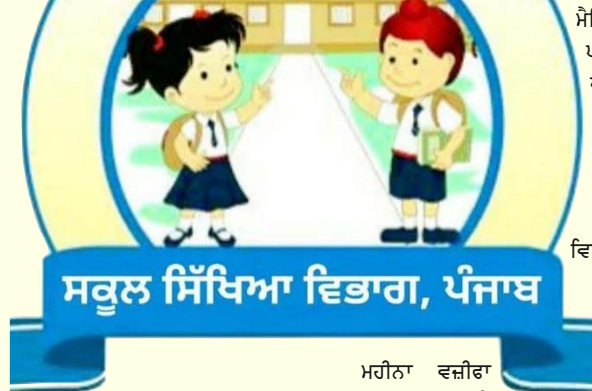
ਮਹੀਨਾ ਵਜ਼ੀਫਾ ਕੇਂਦਰ ਸਰਕਾਰ ਵੱਲੋਂ ਸਰਕਾਰੀ, ਦਿੱਤਾ ਜਾਣਾ ਹੈ।

ਐੱਨ.ਐੱਨ.ਐੱਮ.ਐੱਸ. ਦੀ ਸਾਂਝੀ ਵਜ਼ੀਫਾ ਮੁਕਾਬਲਾ ਪ੍ਰੀਖਿਆ ਆਯੋਜਿਤ ਕੀਤੀ ਗਈ ਹੈ।