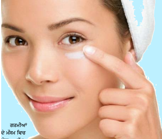
ਗਰਮੀਆਂ ਦੇ ਮੌਸਮ ਵਿਚ ਤੇਜ਼ ਧੁੱਪ

ਵਿਚ ਬਾਹਰ ਘੁੰਮਣ ਨਾਲ ਸੂਰਜ ਦੀਆਂ ਪੈਰਾਬੈਂਗਣੀ ਕਿਰਨਾਂ ਨਾਲ ਟੈਨਿੰਗ ਅਤੇ ਸਨਬਰਨ ਦੀ ਸਮੱਸਿਆ ਆਪਣੇ ਸਿਖਰ @ਤੇ ਹੁੰਦੀ ਹੈ। ਸੂਰਜ ਦੀ ਗਰਮੀ ਅਤੇ ਹਵਾ ਪ੍ਰਦੂਸ਼ਣ ਦੀ ਵਜ੍ਹਾ ਨਾਲ ਚਿਹਰੇ @ਤੇ ਕੋਲ, ਮੁਹਾਸੇ, ਛਾਈਆਂ, ਕਾਲੇ ਦਾਗ, ਬਲੈਕ ਹੱਡ ਅਤੇ ਪਸੀਨੇ ਦੀ ਬਦਬੂ ਦੀ ਸਮੱਸਿਆ ਆਮ ਹੋ ਜਾਂਦੀ ਹੈ, ਜਿਸ ਨਾਲ ਚਮੜੀ ਨੂੰ ਪੂਰਾ ਗ੍ਰਹਿਣ ਜਿਹਾ ਲੱਗ ਜਾਂਦਾ ਹੈ ਅਤੇ ਤੁਸੀਂ ਘਰੋਂ ਬਾਹਰ ਨਿਕਲਣ ਵਿਚ ਅਸਹਿਜ