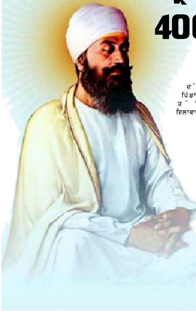
ਦੇ ਪਿੰਡਾਂ ਤੋਂ ਇਲਾਵਾ

ਫੈਸਲਾ ਕੀਤਾ ਕਿ ਗੈਰ-ਮੁਸਲਮਾਨਾਂ ਨੂੰ ਮੁਸਲਮਾਨ ਬਣਾਇਆ ਜਾਵੇ ਉਸ ਨੇ ਇਸ ਲਈ ਸਭ ਤੋਂ ਪਹਿਲਾਂ ਕਸ਼ਮੀਰ ਨੂੰ ਚੁਣਿਆ ਕਿਉਂਕਿ ਉਹ ਸੋਚਦਾ ਸੀ ਕਿ ਕਸ਼ਮੀਰ ਦੇ ਪੰਡਿਤ ਬਹੁਤ ਵਿਦਵਾਨ ਹਨ ਇਸ ਲਈ ਜੇਕਰ ਉਹ ਇਸਲਾਮ ਧਰਮ ਆਣਾ ਲੈਣਗੇ ਤਾਂ ਬਾਕੀ ਦੇ ਆਮ ਲੋਕ ਵੀ ਉਨ੍ਹਾਂ ਵੱਲ ਵੇਖ ਕੇ ਅਸਾਨੀ ਨਾਲ ਆਪਣਾ ਧਰਮ ਬਦਲ ਲੈਣਗੇ।