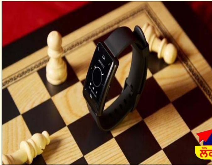
ਰੋਜ਼ਾਨਾ ਲੋਕ ਬਾਣੀ

ਰੀਅਲਮੀ ਟੈਕਲਾਈਵ ਈਕੋਸਿਸਟਮ ਦੇ ਤਹਿਤ ਪਹਿਲੇ ਬ੍ਰਾਂਡ, ਡੀਜੋ ਨੇ ਅੱਜ ਬ੍ਰਾਂਡ ਵੱਲੋਂ ਪਹਿਲੀ ਰੈਕਟੈਂਗੁਲਰ ਸਮਾਰਟਵਾਚ ਡੀਜੋ ਵਾਚ ਐਸ ਦਾ ਲਾਂਚ ਕੀਤਾ। ਗ੍ਰਾਹਕ ਦੀਆਂ ਭਿੰਨ ਅਤੇ ਅਦਭੁਤ ਫੈਸ਼ਨ ਅਭਿਰੁਚੀ ਦੇ ਅਨੁਸਾਰ ਡਿਜਾਇਨ ਕੀਤੀ ਗਈ, ਲੇਟੇਸਟ ਡੀਜੋ ਵਾਚ ਐਸ @ਚ ਰੈਕਟੈਂਗੁਲਰ ਅਤੇ ਸਲਿੱਮ ਬਾਡੀ, ਖੂਬਸੂਰਤ, ਕਵਰਡ ਗਲਾਸ, ਕਵਰਡ ਬਾਡੀ, ਮੈਟਲ ਫ੍ਰੇਮ, 1.57@ (4 ਸੈਮੀ.) ਦੀ ਸਕ੍ਰੀਨ, ਸਭ ਤੋਂ ਵੱਡਾ ਰੈਕਟੈਂਗੁਲਰ ਡਿਸਪਲੇ, 550 ਨਿਟਸ ਦੀ ਹਾਈ ਬ੍ਰਾਈਟਨੈਸ, ਪਰਸਨਲਾਈਜ਼ੇਸ਼ਨ ਦੇ ਵਿਕਲਪ ਦੇ ਨਾਲ 150 ਨਾਲੋਂ ਜ਼ਿਆਦਾ ਵਾਚ ਫੇਸ ਅਤੇ ਤਿੰਨ ਵਿਚਿੱਤਰ ਅਤੇ ਟਰੈਕਿੰਗ ਕਲਰ ਵਿਕਲਪ ਹਨ। ਰੈਕਟੈਂਗੁਲਰ ਡਾਯਲ ਪ੍ਰੇਮੀਆਂ ਨੂੰ ਹੁਣ ਅਤਿਅਧੁਨਿਕ ਹੈਲਥ ਅਤੇ ਮਲਟੀ-ਸਪੋਰਟ ਟਰੈਕਿੰਗ ਦੀ ਸੁਵਿਧਾ ਅਤੇ ਹੋਰ ਉੱਤਮ ਖਾਸੀਅਤਾਂ ਬਹੁਤ