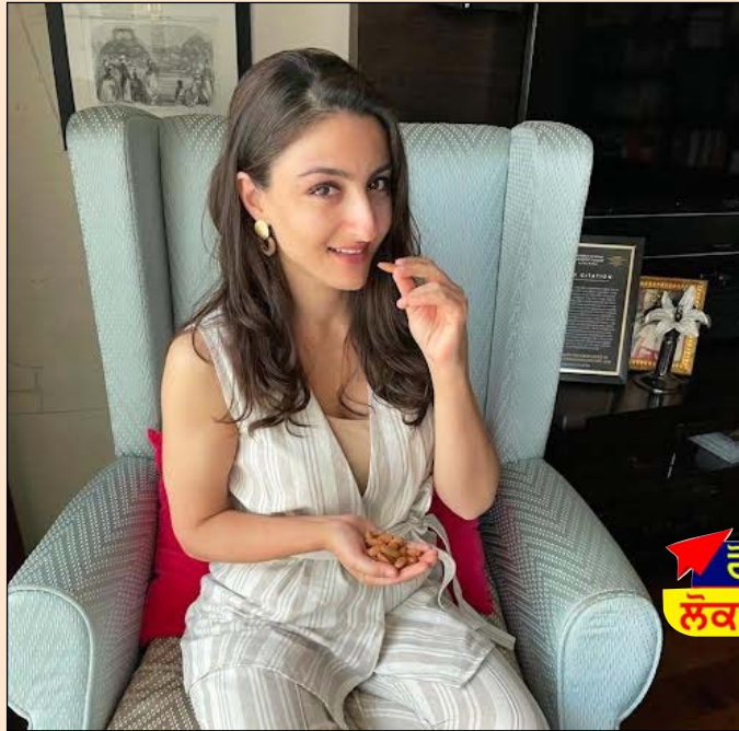
ਮੇਰੀ ਹਰ ਸਵੇਰ ਦੀ ਸ਼ੁਰੂਆਤ ਮੁੱਠੀ ਸਵੇਰੇ ਕਸਰਤ ਕਰਦੀ ਹਾਂ, ਮੈਂ ਬਦਾਮ ਭਰ ਬਦਾਮ ਨਾਲ ਹੁੰਦੀ ਹੈ। ਕਿਉਂਕਿ ਮੈਂ ਵਰਗੇ ਸਿਹਤਮੰਦ ਗਿਰੀਦਾਰ ਖਾਣਾ

ਹਰ ਵਧਦੇ ਦਿਨ ਦੇ ਨਾਲ, ਇਹ ਸਮਝਣਾ ਮਹੱਤਵਪੂਰਨ ਹੋ ਗਿਆ ਹੈ ਕਿ ਸਾਡੀ ਪ੍ਰਮੁੱਖ ਤਰਜੀਹ ਆਪਣੇ ਅਜੀਜ਼ਾਂ ਅਤੇ ਆਪਣੇ ਆਪ ਦੀ ਦੇਖਭਾਲ ਕਰਨਾ ਹੈ। ਵੱਡੇ ਹੁੰਦੇ ਹੋਏ, ਮੇਰੀ ਮਾਂ ਨੇ ਛੋਟੀ ਉਮਰ ਤੋਂ ਹੀ ਸਿਹਤਮੰਦ ਖਾਣ-ਪੀਣ ਦੀਆਂ ਆਦਤਾਂ ਨੂੰ ਯਕੀਨੀ ਬਣਾਇਆ ਅਤੇ ਮੈਂ ਕੁਦਰਤੀ ਤੌਰ 'ਤੇ ਇੱਕ ਸਿਹਤਮੰਦ ਜੀਵਨ ਸ਼ੈਲੀ ਦੀ ਪਾਲਣਾ ਕਰਨ ਦੀ ਆਦੀ ਹੋ ਗਈ ਹਾਂ। ਮੈਂ ਆਪਣੀ ਧੀ ਲਈ ਵੀ ਇਸ ਦਾ ਪਾਲਣ ਕਰਨਾ ਯਕੀਨੀ ਬਣਾਇਆ, ਕਿਉਂਕਿ ਇਹ ਲੰਬੇ ਸਮੇਂ ਵਿੱਚ ਉਸਦੀ ਮਦਦ ਕਰੇਗਾ। ਮੈਂ ਸਧਾਰਨ ਕਦਮਾਂ ਦੀ ਪਾਲਣਾ ਕਰਦੀ ਹਾਂ, ਜਿਨ੍ਹਾਂ ਨੂੰ ਹਰ ਕਿਸੇ ਲਈ ਗ੍ਰਹਿਣ ਕਰਨਾ ਆਸਾਨ ਹੁੰਦਾ ਹੈ ਅਤੇ ਇਹ ਸੁਨਿਸ਼ਚਿਤ ਕਰਦਾ ਹੈ ਕਿ ਇਹਨਾਂ 3-ਸਵੇਰ ਦੀਆਂ ਰਸਮਾਂ ਨੂੰ ਛੱਡਣਾ ਨਹੀਂ ਚਾਹੀਦਾ ਜੋ ਮੈਨੂੰ ਇੱਕ ਬਿਹਤਰ ਕੱਲ੍ਹ ਨੂੰ ਅਗਵਾਈ ਕਰਨ ਵਿੱਚ ਮਦਦ ਕਰਦੀਆਂ ਹਨ।