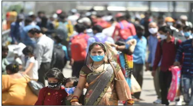
ਮਾਸਕ ਪਹਿਨਣ ਦੀ ਸਲਾਹ ਦਿੱਤੀ ਜਾਂਦੀ ਹੈ। ਮਾਸਕ ਪਹਿਨਣ ਨੂੰ ਖਾਸ ਤੌਰ @ਤੇ ਬੰਦ ਵਾਤਾਵਰਨ ਵਿੱਚ ਯਕੀਨੀ ਬਣਾਉਣ ਦੀ ਲੋੜ ਹੈ। ਪ੍ਰਸ਼ਾਸਨ ਮੁਕਾਬਲ ਜਨਤਕ ਆਵਾਜਾਈ (ਬੱਸਾਂ, ਰੇਲਗੱਡੀਆਂ, ਹਵਾਈ ਜਹਾਜ਼ ਅਤੇ ਟੈਕਸੀ ਆਦਿ) ਵਿੱਚ ਪੂਰੀ ਯਾਤਰਾ

ਮੌਜੂਦਾ ਹਾਲਾਤ ਦੇ ਮੱਦੇਨਜ਼ਰ ਚੰਡੀਗੜ੍ਹ ਪ੍ਰਸ਼ਾਸਨ ਨੇ ਭੀੜ ਵਾਲੀਆਂ ਥਾਵਾਂ ਉੱਤੇ ਮਾਸਕ ਪਾਉਣ ਸਬੰਧੀ ਸਲਾਹ ਜਾਰੀ ਕੀਤੀ ਹੈ। ਪ੍ਰਸ਼ਾਸਨ ਵੱਲੋਂ ਜਾਰੀ ਕੀਤੇ ਹੁਕਮਾਂ ਵਿਚ ਆਖਿਆ ਗਿਆ ਹੈ ਕਿ ਕੁਝ ਰਾਜਾਂ ਅਤੇ ਕੇਂਦਰ ਸ਼ਾਸਿਤ ਪ੍ਰਦੇਸ਼ਾਂ ਵਿੱਚ ਕੋਵਿਡ ਦੇ ਕੇਸਾਂ ਦੀ ਵਧਦੀ ਗਿਣਤੀ ਨੂੰ ਧਿਆਨ ਵਿੱਚ ਰੱਖਦੇ ਹੋਏ ਚੂਟੀ ਚੰਡੀਗੜ੍ਹ ਦੇ ਸਾਰੇ ਵਸਨੀਕਾਂ ਨੂੰ ਭੀੜ ਵਾਲੀਆਂ ਥਾਵਾਂ @ਤੇ ਚਿਹਰੇ ਉੱਤੇ