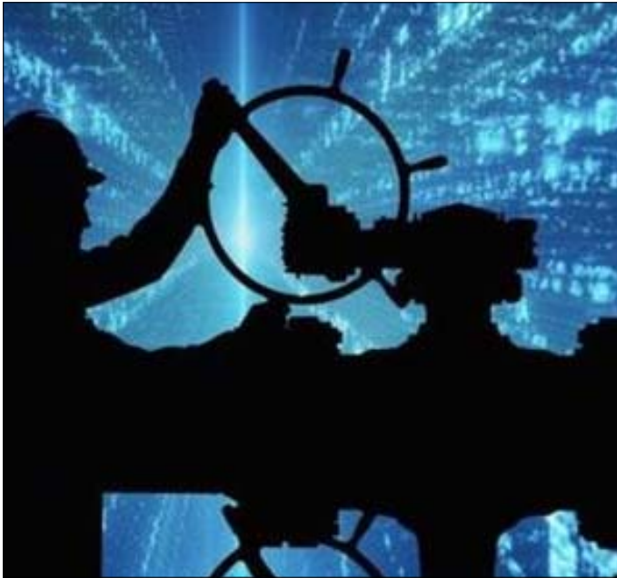
ਕਾਰੋਬਾਰ ਨੂੰ ਕਾਫੀ ਨੁਕਸਾਨ ਹੋਇਆ ਅਤੇ ਇਸ ਨੂੰ ਠੀਕ ਕਰਨ @ਚ ਵੀ ਕਾਫੀ ਸਮਾਂ ਲੱਗਾ।

ਸਾਈਬਰ ਅਪਰਾਧੀਆਂ ਨੇ ਸਰਕਾਰੀ ਤੇਲ ਕੰਪਨੀ ਆਇਲ ਇੰਡੀਆ ਲਿਮਿਟਿਡ (OIL) ਨੂੰ ਨਿਸ਼ਾਨਾ ਬਣਾਇਆ ਹੈ। ਅਸਾਮ @ਚ ਕੰਪਨੀ ਦੇ ਹੈੱਡਕੁਆਰਟਰ @ਤੇ ਸਾਈਬਰ ਹਮਲਾ ਹੋਇਆ ਸੀ। ਸਾਈਬਰ ਹਮਲਾਵਰਾਂ ਨੇ ਵਾਇਰਸ ਭੇਜ ਕੇ ਕੰਪਨੀ ਦੇ ਸਿਸਟਮ ਅਤੇ ਕੰਪਿਊਟਰਾਂ @ਤੇ ਕਬਜ਼ਾ ਕਰ ਲਿਆ ਅਤੇ ਇਸ ਨੂੰ ਜਾਰੀ ਕਰਨ ਲਈ 75 ਲੱਖ ਡਾਲਰ (ਲਗਭਗ 57 ਕਰੋੜ ਰੁਪਏ) ਦੀ ਮੰਗ ਕੀਤੀ। ਸਾਈਬਰ ਅਪਰਾਧੀਆਂ ਨੇ ਇਹ ਰਕਮ ਬਿਟਕੋਆਇਨ ਦੇ ਰੂਪ ਵਿੱਚ ਅਦਾ ਕਰਨ ਦੀ ਸ਼ਰਤ ਰੱਖੀ ਹੈ। ਕੰਪਨੀ ਨੇ ਕਿਹਾ ਕਿ ਹਾਲਾਂਕਿ ਭੂ-ਵਿਗਿਆਨ ਅਤੇ ਭੰਡਾਰ ਵਿਭਾਗ @ਤੇ ਹਮਲਾ 10 ਅਪ੍ਰੈਲ ਨੂੰ ਕੀਤਾ ਗਿਆ ਸੀ, ਪਰ ਇਸ ਦੀ ਸੂਚਨਾ ਆਈਟੀ ਵਿਭਾਗ ਨੇ ਮੰਗਲਵਾਰ ਨੂੰ ਦਿੱਤੀ।