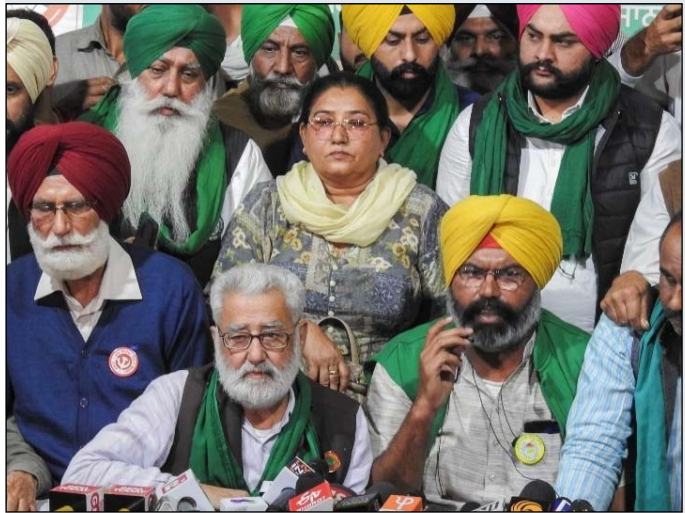
ਦਿੱਲੀ/ਕਪੂਰ ਸੰਯੁਕਤ ਕਿਸਾਨ ਮੋਰਚਾ ਕਿਸਾਨਾਂ ਲਈ ਘੱਟ-ਘੱਟ ਸਮਰਥਨ ਮੁੱਲ (MSP) 'ਤੇ ਕਾਨੂੰਨੀ ਗਾਰੰਟੀ

ਪੰਜਾਬ ਦੇ ਲੋਕ ਬਿਜਲੀ ਦੇ ਲੱਗ ਰਹੇ ਕੱਟਾਂ ਕਾਰਨ ਪਰੇਸ਼ਾਨ ਜਲੰਧਰ/ਹਰਬੰਸ ਬਿਟੂ ਪੰਜਾਬ ਰਾਜ ਪਾਵਰ ਕਾਰਪੋਰੇਸ਼ਨ ਲਿਮਿਟਡ (ਪੀਐੱਸਪੀਸੀਐੱਲ), ਜੋ ਕੱਲ ਦੀ ਘਾਟ ਦਾ ਸਾਹਮਣਾ ਕਰ ਰਹੀ ਹੈ, ਪਿੰਡਾਂ ਵਿੱਚ ਇੱਕ ਤੋਂ ਪੰਜ ਘੰਟੇ ਅਤੇ ਸ਼ਹਿਰਾਂ ਵਿੱਚ ਇੱਕ ਤੋਂ ਦੋ ਘੰਟੇ ਤੱਕ ਬਿਜਲੀ ਕੱਟ ਲਗਾ ਰਹੀ ਹੈ। ਬਿਜਲੀ ਕੱਟਾਂ ਤੋਂ ਨਿਗਮ ਇਨਕਾਰ ਰਹੀ ਹੈ। ਬੁੱਧਵਾਰ ਸਵੇਰੇ ਪਟਿਆਲਾ, ਲੁਧਿਆਣਾ, ਜਲੰਧਰ, ਸੰਗਰੂਰ ਅਤੇ ਅੰਮ੍ਰਿਤਸਰ ਸ਼ਹਿਰਾਂ ਵਿੱਚ ਬਿਜਲੀ ਕੱਟ ਲੱਗ ਗਏ।