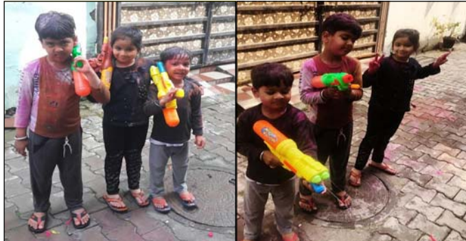
ਗੁਰਦਾਸਪੁਰ ਚ ਬੱਚਿਆਂ ਨੇ ਇਕ ਦੂਜੇ ਨੂੰ ਰੰਗ ਲਾ ਕੇ ਮਨਾਇਆ ਹੋਲੀ ਦਾ ਤਿਉਹਾਰ।