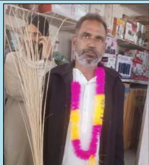
ਵਲਟੋਹਾ ਵਿੱਚ ਜਿੱਤ ਦੀ ਖੁਸ਼ੀ ਮਨਾਉਂਦਾ ਹੋਇਆ ਇੱਕ ਆਪ ਵਰਕਰ।