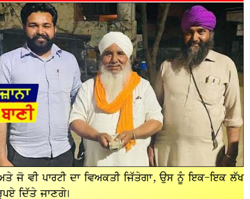
ਅਤੇ ਜੋ ਵੀ ਪਾਰਟੀ ਦਾ ਵਿਅਕਤੀ ਜਿੱਤੇਗਾ, ਉਸ ਨੂੰ ਇਕ-ਇਕ ਲੱਖ ਰੁਪਏ ਦਿੱਤੇ ਜਾਣਗੇ।