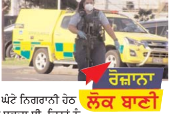
ਨਿਊਜ਼ੀਲੈਂਡ ਦੇ ਅਧਿਕਾਰੀਆਂ ਨੇ ਅੱਜ ਕਿਹਾ ਕਿ ਉਨ੍ਹਾਂ ਨੇ ਸੁਪਰਮਾਰਕੀਟ ਵਿੱਚ ਛੇ ਲੋਕਾਂ ਨੂੰ ਚਾਕੂ ਮਾਰਨ ਵਾਲੇ ਹਿੰਸਕ ਕੱਟੜਪੰਥੀ ਨੂੰ ਗੋਲੀ ਮਾਰ ਕੇ ਮਾਰ ਦਿੱਤਾ ਹੈ।

ਵੈਲਿੰਗਟਨ/ਲੋਕ ਬਾਣੀ ਨਿਊਜ਼ੀਲੈਂਡ ਦੇ ਅਧਿਕਾਰੀਆਂ ਨੇ ਅੱਜ ਕਿਹਾ ਕਿ ਉਨ੍ਹਾਂ ਨੇ ਸੁਪਰਮਾਰਕੀਟ ਵਿੱਚ ਛੇ ਲੋਕਾਂ ਨੂੰ ਚਾਕੂ ਮਾਰਨ ਵਾਲੇ ਹਿੰਸਕ ਕੱਟੜਪੰਥੀ ਨੂੰ ਗੋਲੀ ਮਾਰ ਕੇ ਮਾਰ ਦਿੱਤਾ ਹੈ। ਪ੍ਰਧਾਨ ਮੰਤਰੀ ਨੇ ਇਸ ਨੂੰ ਅਤਿਵਾਦੀ ਹਮਲਾ ਕਰਾਰ ਦਿੱਤਾ ਹੈ। ਉਨ੍ਹਾਂ ਕਿਹਾ ਕਿ ਹਮਲਾਵਰ ਸ਼ੀਲੰਕਾ ਦਾ ਨਾਗਰਿਕ ਸੀ, ਜੋ ਇਸਲਾਮਿਕ ਸਟੇਟ ਸਮੂਹ ਦੇ ਪ੍ਰਭਾਵ ਹੇਠ ਸੀ। ਉਹ ਦੇਸ਼ ਦੀਆਂ ਸੁਰੱਖਿਆ ਏਜੰਸੀਆਂ ਦੀ ਗਾਰੰਟੀ 'ਤੇ ਸੀ ਅਤੇ ਚੌਕੀ ਘੰਟੇ ਨਿਗਰਾਨੀ ਹੇਠ ਸੀ। ਕਾਨੂੰਨ ਮੁਤਾਬਕ ਉਸ ਨੂੰ ਜੇਲ੍ਹ ਵਿੱਚ ਨਹੀਂ ਰੱਖਿਆ ਜਾ ਸਕਦਾ ਸੀ, ਜਿਨ੍ਹਾਂ ਨੂੰ ਛੁਰਾ ਮਾਰਿਆ ਗਿਆ ਹੈ ਉਨ੍ਹਾਂ ਵਿਚੋਂ ਤਿੰਨ ਦੀ ਹਾਲਤ ਗੰਭੀਰ ਹੈ।