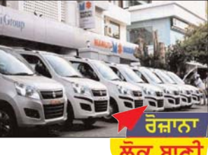
ਨਵੀਂ ਦਿੱਲੀ/ਕਪੂਰ ਦੇਸ਼ ਦੀ ਸਭ ਤੋਂ ਵੱਡੀ ਵਾਹਨ ਨਿਰਮਾਤਾ ਮਾਰੂਤੀ ਸੂਜੂ ਕੀ ਇੰਡੀਆ (ਐੱਮ.ਐੱਸ.ਆਈ) ਨੇ ਖਰਾਬ ਮੋਟਰ ਜਨਰੇਟਰ ਨੂੰ ਬਦਲਣ ਲਈ ਸੀ.ਆਜ਼, ਵਿਟਾਰਾ ਬ੍ਰੇਜ਼ਾ ਅਤੇ ਐੱਕਸਐੱਲ 6 ਸਮੇਤ ਵੱਖ ਵੱਖ ਮਾਡਲਾਂ ਦੀਆਂ 1,81,754 ਗੱਡੀਆਂ ਨੂੰ ਵਾਪਸ ਮੰਗਵਾਇਆ ਹੈ।

ਨਵੀਂ ਦਿੱਲੀ/ਕਪੂਰ ਦੇਸ਼ ਦੀ ਸਭ ਤੋਂ ਵੱਡੀ ਵਾਹਨ ਨਿਰਮਾਤਾ ਮਾਰੂਤੀ ਸੂਜੂ ਕੀ ਇੰਡੀਆ (ਐੱਮ.ਐੱਸ.ਆਈ) ਨੇ ਖਰਾਬ ਮੋਟਰ ਜਨਰੇਟਰ ਨੂੰ ਬਦਲਣ ਲਈ ਸੀ.ਆਜ਼, ਵਿਟਾਰਾ ਬ੍ਰੇਜ਼ਾ ਅਤੇ ਐੱਕਸਐੱਲ 6 ਸਮੇਤ ਵੱਖ ਵੱਖ ਮਾਡਲਾਂ ਦੀਆਂ 1,81,754 ਗੱਡੀਆਂ ਨੂੰ ਵਾਪਸ ਮੰਗਵਾਇਆ ਹੈ। ਕੰਪਨੀ ਨੇ ਕਿਹਾ ਕਿ ਇਹ ਫੈਸਲਾ 4 ਮਈ 2018 ਅਤੇ 27 ਅਕਤੂਬਰ 2020 ਦੇ ਵਿਚਕਾਰ ਤਿਆਰ ਕੀਤੇ ਮਾਡਲਾਂ ਵਿੱਚ ਖਰਾਬੀ ਦੀ ਜਾਂਚ ਲਈ ਕੀਤਾ ਗਿਆ ਹੈ।