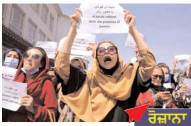
ਕੁੱਝ ਔਰਤਾਂ ਨੇ ਅੱਜ ਇਥੇ ਅਫਗਾਨਿਸਤਾਨ ਦੀ ਰਾਜਧਾਨੀ ਕਾਬੁਲ ਵਿੱਚ ਰਾਸਟਰਪਤੀ ਨਿਵਾਸ ਦੇ ਬਾਹਰ ਪ੍ਰਦਰਸ਼ਨ ਕਰਕੇ ਦੇਸ਼ ਦੀ ਨਵੀਂ ਤਾਲਿਬਾਨ ਲੀਡਰਸ਼ਿਪ ਨੂੰ ਔਰਤਾਂ ਦੇ ਅਧਿਕਾਰਾਂ ਨੂੰ ਬਰਕਰਾਰ ਰੱਖਣ ਅਤੇ ਆਉਣ ਵਾਲੀ ਸਰਕਾਰ ਵਿੱਚ ਔਰਤਾਂ ਪ੍ਰਤੀਨਿਧਤਾ ਦੇਣ ਦੀ ਅਪੀਲ ਕੀਤੀ।

ਕਾਬੁਲ/ਲੋਕ ਬਾਣੀ ਕੁੱਝ ਔਰਤਾਂ ਨੇ ਅੱਜ ਇਥੇ ਅਫਗਾਨਿਸਤਾਨ ਦੀ ਰਾਜਧਾਨੀ ਕਾਬੁਲ ਵਿੱਚ ਰਾਸਟਰਪਤੀ ਨਿਵਾਸ ਦੇ ਬਾਹਰ ਪ੍ਰਦਰਸ਼ਨ ਕਰਕੇ ਦੇਸ਼ ਦੀ ਨਵੀਂ ਤਾਲਿਬਾਨ ਲੀਡਰਸ਼ਿਪ ਨੂੰ ਔਰਤਾਂ ਦੇ ਅਧਿਕਾਰਾਂ ਨੂੰ ਬਰਕਰਾਰ ਰੱਖਣ ਅਤੇ ਆਉਣ ਵਾਲੀ ਸਰਕਾਰ ਵਿੱਚ ਔਰਤਾਂ ਪ੍ਰਤੀਨਿਧਤਾ ਦੇਣ ਦੀ ਅਪੀਲ ਕੀਤੀ। 12 ਔਰਤਾਂ ਨੇ ਰਾਸਟਰਪਤੀ ਭਵਨ ਦੇ ਗੇਟ 'ਤੇ ਪੋਸਟਰ ਫੜੇ ਹੋਏ ਸਨ ਜਿਨ੍ਹਾਂ 'ਤੇ ਲਿਖਿਆ ਸੀ, 'ਔਰਤਾਂ ਦੀ ਸ਼ਮੂਲੀਅਤ ਵਾਲਾ ਸਾਹਸੀ ਕੌਬਨਿਟ'