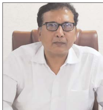
ਵਿਕਾਸ ਵਿਭਾਗ ਪੰਜਾਬ ਵਲੋਂ ਡਿਪਟੀ ਕਮਿਸ਼ਨਰ ਦੇ ਧਿਆਨ ਵਿਚ ਲਿਆਂਦਾ ਗਿਆ ਹੈ ਕਿ ਜ਼ਿਲੇ ਦੇ ਸਾਰੇ ਸੇਵਾ ਕੇਂਦਰਾਂ ਵਿਚ ਲੋਕ, ਸੇਵਾ ਕੇਂਦਰਾਂ ਵਿਚ ਜਾ