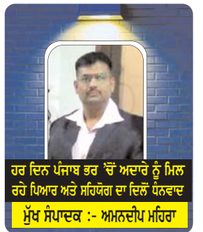
ਹਰ ਦਿਨ ਪੰਜਾਬ ਭਰ 'ਚੋਂ ਅਦਾਰੇ ਨੂੰ ਮਿਲ ਰਹੇ ਪਿਆਰ ਅਤੇ ਸਹਿਯੋਗ ਦਾ ਦਿਲੋਂ ਧੰਨਵਾਦ ਮੁੱਖ ਸੰਪਾਦਕ :- ਅਮਨਦੀਪ ਮਹਿਰਾ

R.N.I. Pumpun/29016/2008 ☆ ਸਾਲ : 14 ☆ ਅੰਕ : 217 ☆ ਮੁੱਲ : 2.00 ਰੁਪਏ ☆ ਕੁੱਲ ਪੇਜ : 10 ☆ ਫੋਕਸ : 0181-2211009 ☆ M. 99155-94111