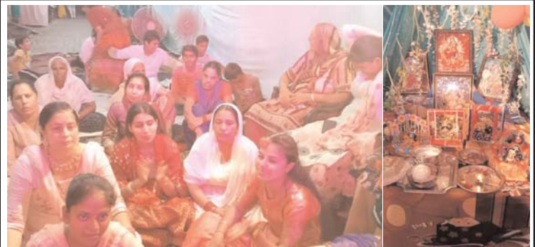
ਪੱਤੀ ਰੂਪਾ ਮੋਗਾ ਵਿਖੇ ਭਗਵਾਨ ਕ੍ਰਿਸ਼ਨ ਜਨਮ ਅਸ਼ਟਮੀ ਨੂੰ ਮੁੱਖ ਰੱਖਦੇ ਹੋਏ ਸ਼੍ਰੀ ਕ੍ਰਿਸ਼ਨ ਭਜਨ ਮੰਡਲੀ ਵੱਲੋਂ ਭਗਵਾਨ ਸ਼੍ਰੀ ਕ੍ਰਿਸ਼ਨ ਜੀ ਦੀ ਪੂਜਾ ਅਤੇ ਗੁਣਗਾਨ ਕੀਤਾ ਗਿਆ ਇਸ ਮੌਕੇ ਸੁੰਦਰ ਝਾਕੀਆਂ ਵੀ ਪੇਸ਼ ਕੀਤੀਆਂ ਗਈਆਂ।