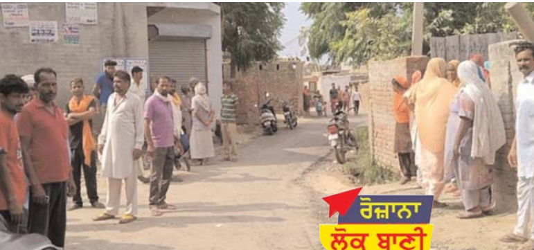
ਰੋਜ਼ਾਨਾ ਲੋਕ ਬਾਣੀ