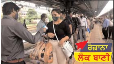
ਰੋਜ਼ਾਨਾ ਲੋਕ ਬਾਣੀ

ਮਾਹਰਾਂ ਦਾ ਦਾਅਵਾ, ਅਕਤੂਬਰ-ਨਵੰਬਰ 'ਚ ਚੋਟੀ 'ਤੇ ਹੋਵੇਗੀ ਕੋਰੋਨਾ ਦੀ ਤੀਜੀ ਲਹਿਰ