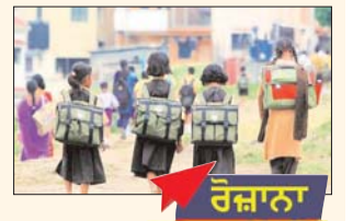
ਰੋਜ਼ਾਨਾ ਲੋਕ ਬਾਣੀ

ਨਵੀਂ ਦਿੱਲੀ/ਲੋਕ ਬਾਣੀ ਦਿੱਲੀ ਸਰਕਾਰ ਨੇ ਨਿੱਜੀ ਮਦਦ ਪ੍ਰਾਪਤ ਅਤੇ ਗੈਰ-ਮਦਦ ਪ੍ਰਾਪਤ ਸਕੂਲਾਂ ਨੂੰ ਨਿਰਦੇਸ਼ ਦਿੱਤਾ ਹੈ ਕਿ ਉਹ ਇਕ ਸਤੰਬਰ ਤੋਂ ਜਮਾਤ 9ਵੀਂ ਅਤੇ 12ਵੀਂ ਲਈ ਸਕੂਲਾਂ ਨੂੰ ਮੁੜ ਖੋਲ੍ਹਣ ਤੋਂ ਪਹਿਲਾਂ ਆਪਣੇ ਅਧਿਆਪਕਾਂ ਅਤੇ ਕਰਮਚਾਰੀਆਂ ਦਾ ਟੀਕਾਕਰਨ ਕਰਵਾਉਣ। ਦਿੱਲੀ ਸਰਕਾਰ ਦੇ ਸਿੱਖਿਆ ਵਿਭਾਗ ਨੇ ਇਸ ਸੰਬੰਧ 'ਚ ਇਕ ਸਰਕੂਲਰ ਜਾਰੀ ਕੀਤਾ। ਇੱਥੇ ਕੋਰੋਨਾ ਦੀ ਸਥਿਤੀ 'ਚ ਸੁਧਾਰ ਤੋਂ ਬਾਅਦ, ਦਿੱਲੀ ਸਰਕਾਰ ਨੇ ਸੁੱਕਰਵਾਰ ਨੂੰ ਐਲਾਨ ਕੀਤਾ ਕਿ ਜਮਾਤ 9ਵੀਂ ਅਤੇ 12ਵੀਂ ਤੱਕ ਦੇ ਸਕੂਲ, ਕਾਲਜ ਅਤੇ ਕੋਚਿੰਗ ਸੰਸਥਾਵਾਂ ਇਕ ਸਤੰਬਰ ਤੋਂ ਮੁੜ ਖੁੱਲ੍ਹਣਗੀਆਂ। ਦਿੱਲੀ ਆਵਤ ਪ੍ਰਬੰਧਨ ਅਥਾਰਟੀ (ਡੀ.ਡੀ.ਐੱਮ.ਏ.) ਦੀ ਬੈਠਕ 'ਚ ਇਹ ਫੈਸਲਾ ਲਿਆ ਗਿਆ।