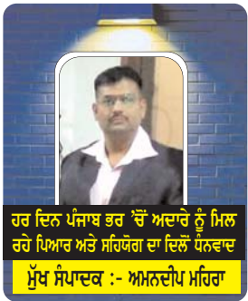
ਹਰ ਦਿਨ ਪੰਜਾਬ ਭਰ 'ਚੋਂ ਅਦਾਰੇ ਨੂੰ ਮਿਲ ਰਹੇ ਪਿਆਰ ਅਤੇ ਸਹਿਯੋਗ ਦਾ ਦਿਲੋਂ ਧਨਵਾਦ ਮੁੱਖ ਸੰਪਾਦਕ :- ਅਮਨਦੀਪ ਮਹਿਰਾ