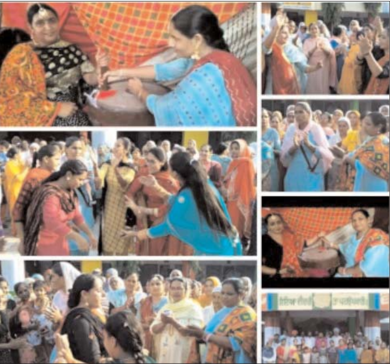
ਘਰ ਆਇਆ ਧੀਆ ਆਪਣੀਆ ਚਿਰਾ ਤੋਂ ਵਿਛੜੀਆ ਹੋਈਆ ਸਹੇਲੀਆ ਨੂੰ ਮਿਲਣ ਦਾ ਇੱਕ ਜਰੀਆ ਹੈ ਤੇ ਉਹ ਗਿੱਧਾ ਪਾਕੇ ਨੱਚ ਟੱਪਕੇ ਬੋਲੀਆ ਰਾਹੀਂ ਆਪਣੇ ਦੁੱਖ ਸੁੱਖ ਦੱਸਕੇ ਆਪਣੇ ਦਿਲ ਦੇ ਵਲਵਲੇ ਕੱਢਦੀਆਂ ਹਨ ਤੇ ਜਦੋਂ ਭਾਦੋਂ ਦਾ ਮਹੀਨਾ ਚੜ ਜਾਣ ਚ ਕੁਛ ਦਿਨ ਬਾਕੀ ਰਹਿੰਦੇ ਹਨ ਤਾ ਉਨ੍ਹਾਂ ਨੂੰ ਪਤਾ ਹੁੰਦਾ ਹੈ ਕਿ ਅਸੀਂ ਆਪਣੀਆ ਸਕੀਆ ਸੁਹੇਲੀਆ ਨਾਲੋਂ ਹੁਣ ਵਿਛੜ ਜਾਣਾ ਹੈ ਤੇ ਸਹੁਰੇ