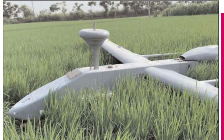
ਗੁਰਦਾਸਪੁਰ-ਨਵਨੀਤ ਕੁਮਾਰ/ਜਤਿੰਦਰ ਕੁਮਾਰ

ਬਲਾਕ ਕਲਾਨੌਰ ਅਧੀਨ ਆਉਂਦੇ ਪਿੰਡ ਮਾਲੋਗਿੱਲ ਦੇ ਖੇਤਾਂ 'ਚ ਡਰੋਨ ਦਾ ਕੰਟ੍ਰੋਲ ਟੁੱਟਣ ਕਾਰਨ ਡਿੱਗੇ ਏਆਰਪੀਏ ਡਰੋਨ ਨੂੰ ਏਅਰ ਫੋਰਸ ਦੇ ਜਵਾਨਾਂ ਨੇ ਕਬਜ਼ੇ 'ਚ ਲੈ ਲਿਆ। ਖੇਤਾਂ 'ਚ ਡਿੱਗੇ ਇਸ ਏਆਰਪੀਏ ਡਰੋਨ ਨੂੰ ਪਿੰਡ ਮਾਲੋਗਿੱਲ, ਖਾਨੋਵਾਲ, ਮੁਸਤਫਾਪੁਰ, ਵਡਾਲਾ ਬਾਂਗਰ, ਦਾਦੁਵਾਲ ਆਦਿ ਪਿੰਡਾਂ ਦੇ ਸੈਂਕੜੇ ਲੋਕ ਵੇਖਣ ਲਈ