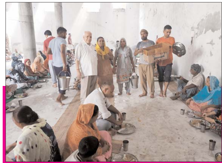
ਮਾਤਾ ਚਿਤਪੁਰਨੀ ਜੀ ਦੇ ਮੇਲੇ ਦੇ ਸਬੰਧ ਵਿੱਚ ਸ਼ਿਵ ਮੰਦਰ ਚਿਲਵਾਂ ਵਿੱਚ ਲਗਾਏ ਪੂਰੀਆਂ-ਛੋਲਿਆਂ, ਖੀਰ ਦੇ ਲੰਗਰ ਦਾ ਦ੍ਰਿਸ਼। (ਸੁਖੀਜਾ)